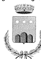
Bagnoli Del trigno